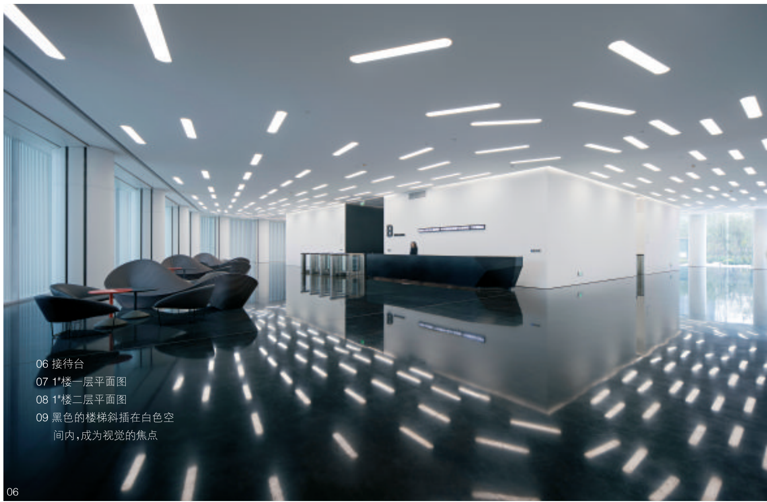
06 接待台 07 1#楼一层平面图 08 1#楼二层平面图 09 黑色的楼梯斜插在白色空间内,成为视觉的焦点