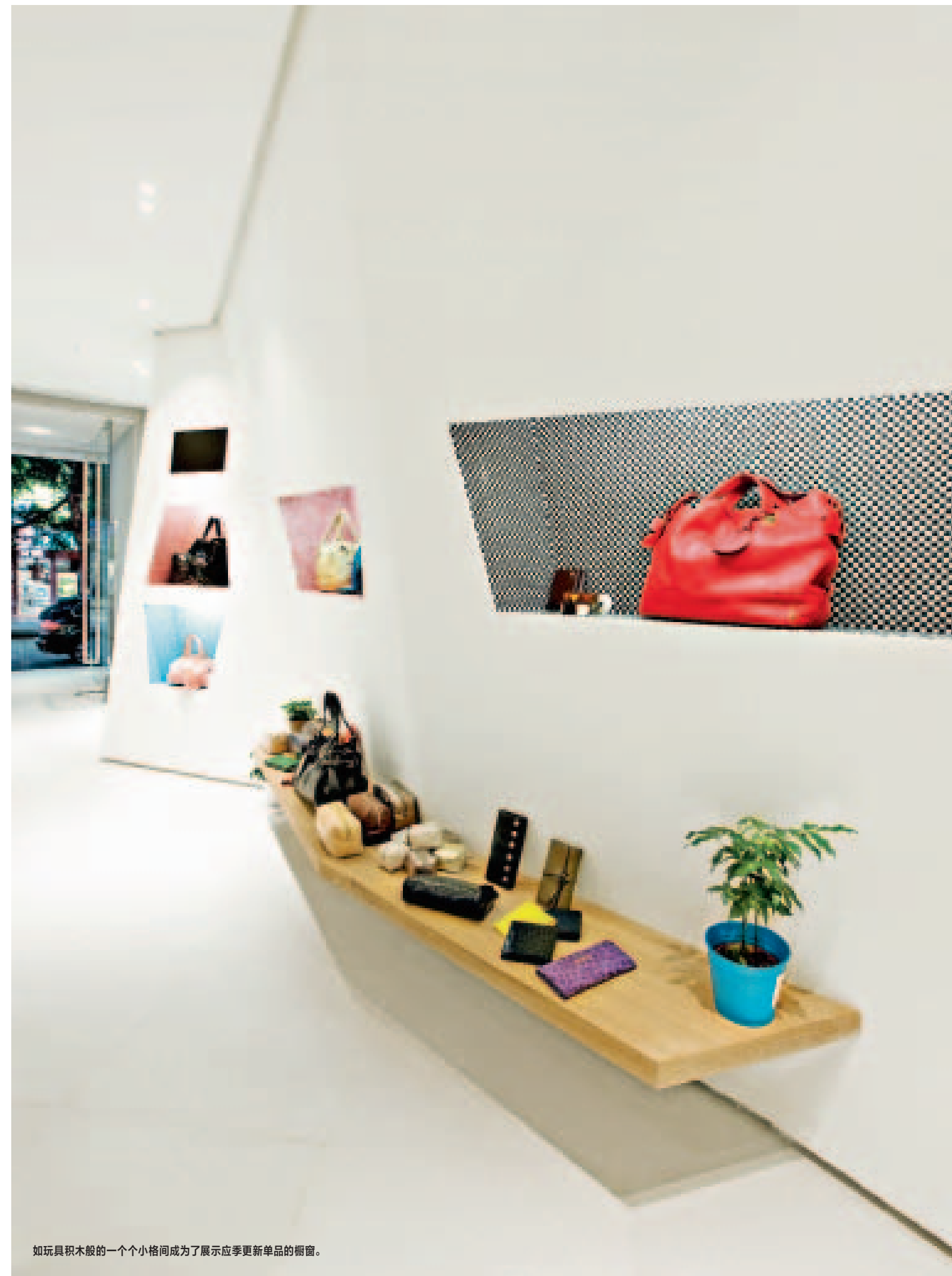
如玩具积木般的一个个小格间成为了展示应季更新单品的橱窗。