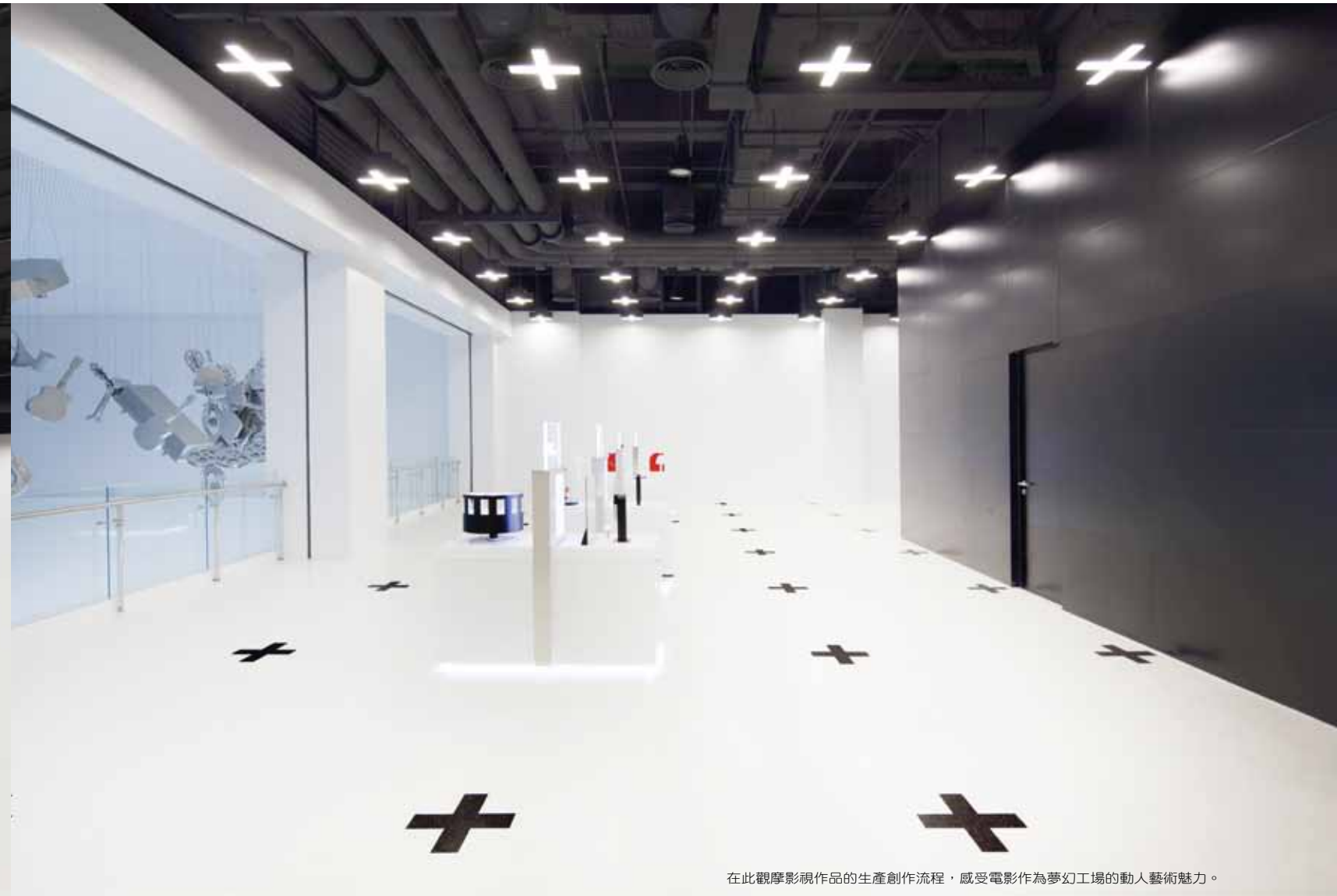
在此觀摩影視作品的生產創作流程，感受電影作為夢幻工場的動人藝術魅力。