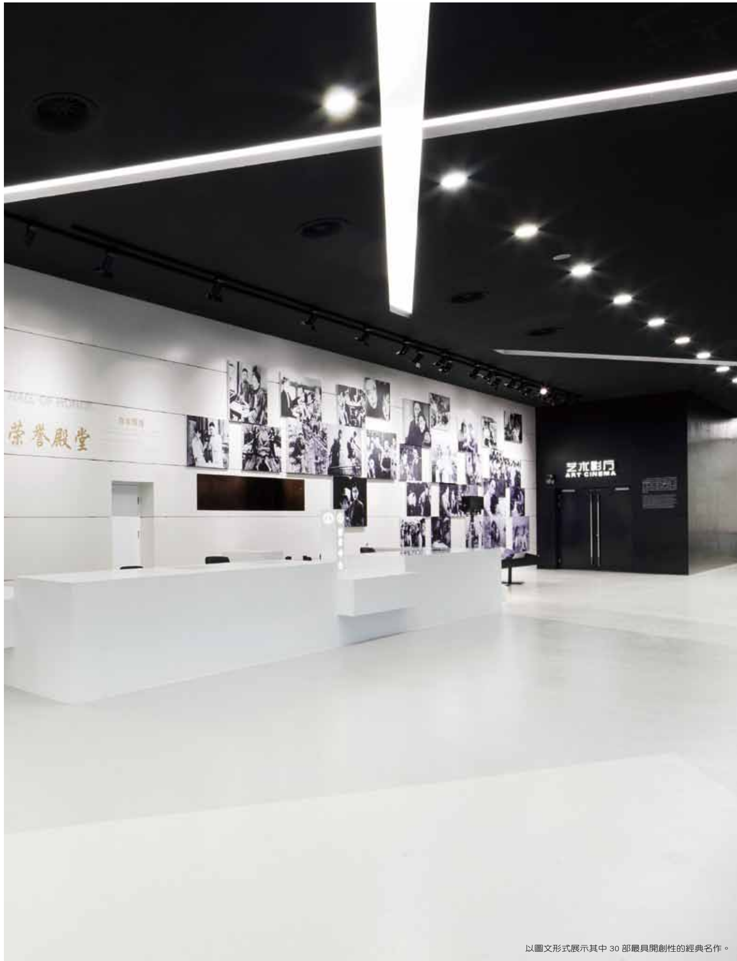
以圖文形式展示其中 30 部最具開創性的經典名作。