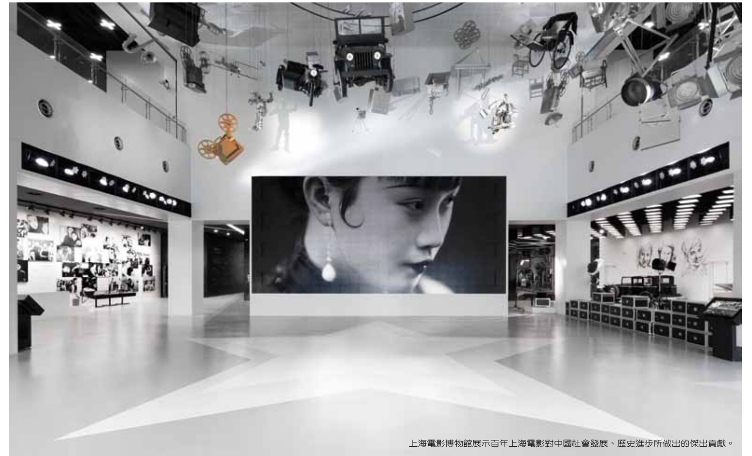
上海電影博物館展示百年上海電影對中國社會發展、歷史進步所做出的傑出貢獻。