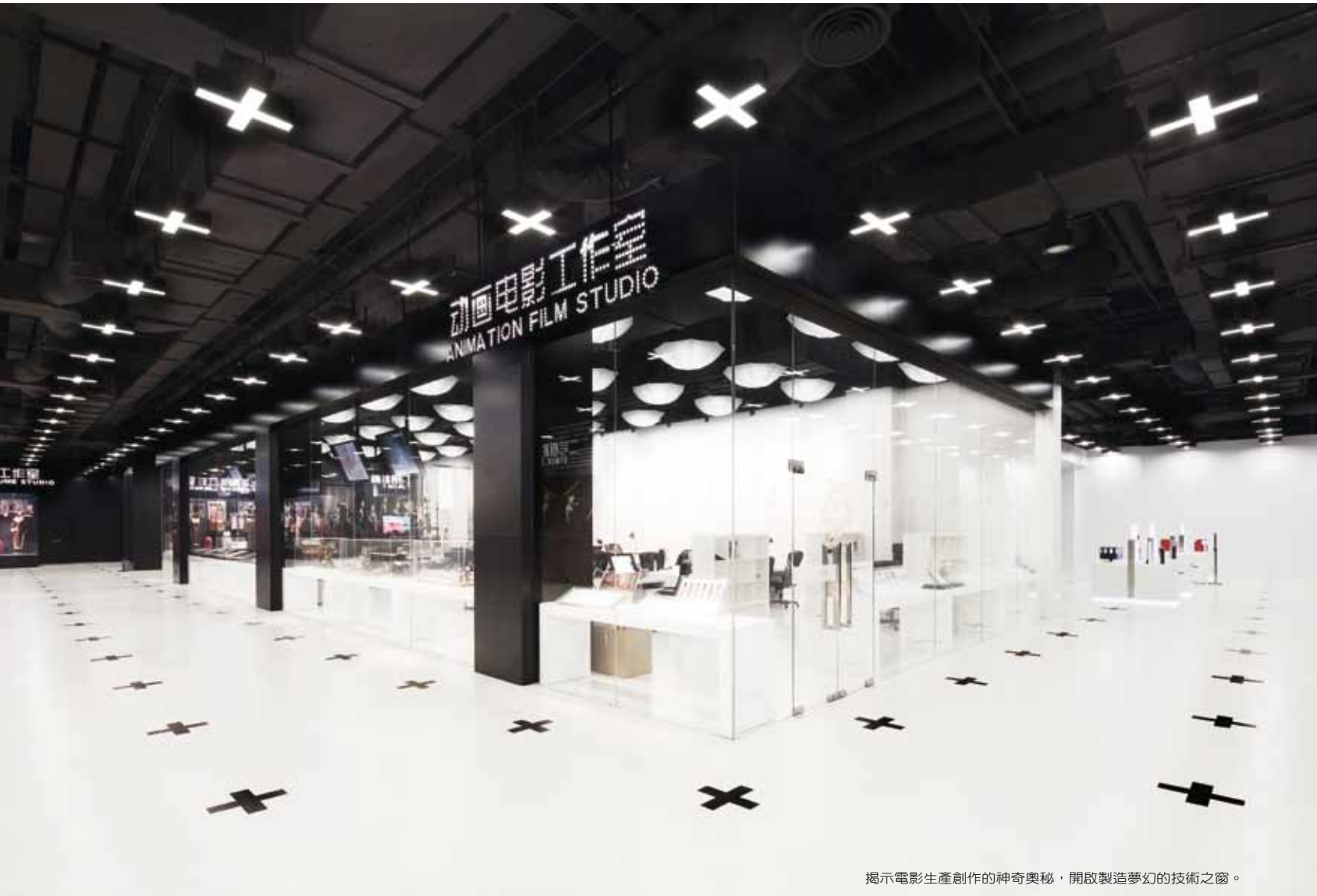
揭示電影生產創作的神奇奧秘，開啟製造夢幻的技術之窗。